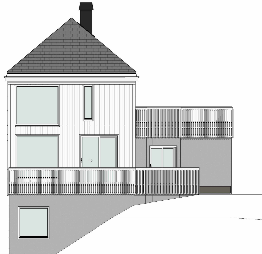
Fasade 3 nordvest